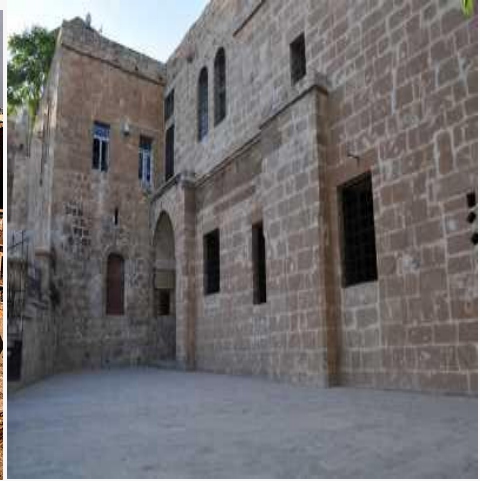
Hatuniye Medresesi, dönemin işçiliğini gözler önüne seriyor.