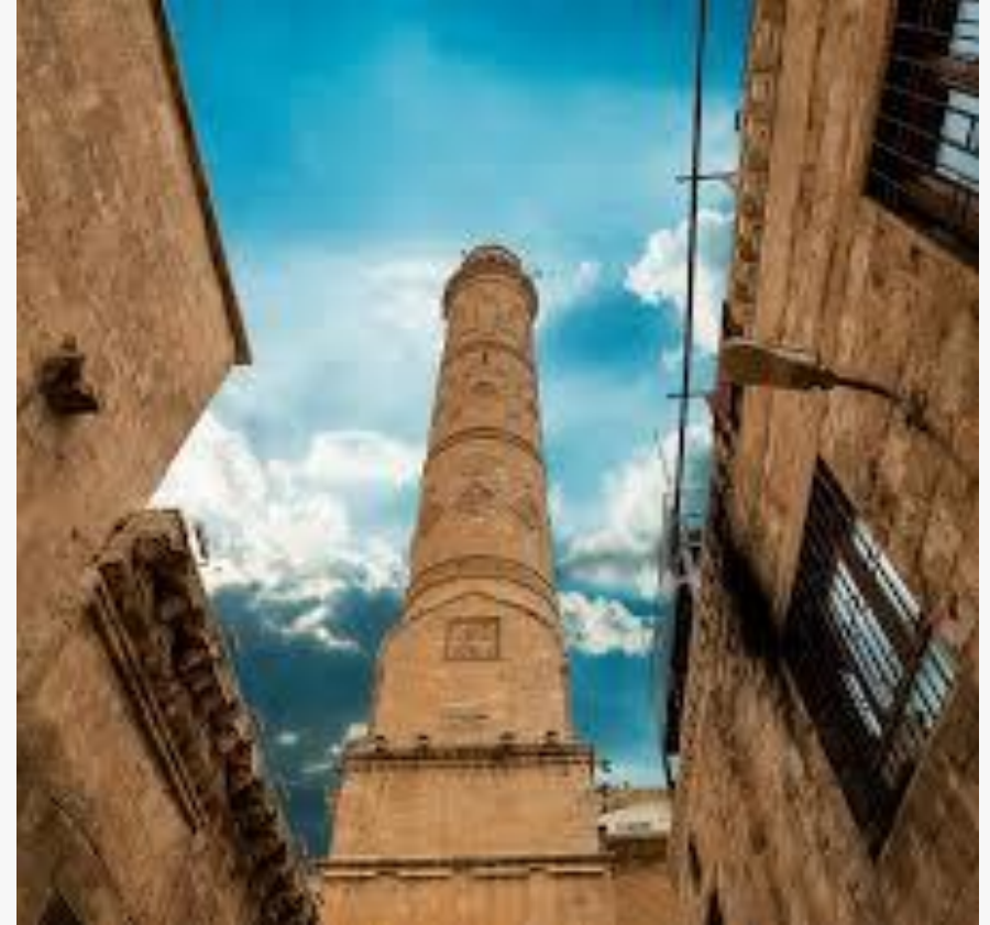
Ulu Camii, Mardin'in en eski camisi.